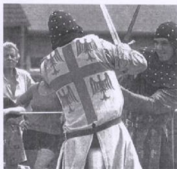
Les scènes de combats sont parfaitement réglées.