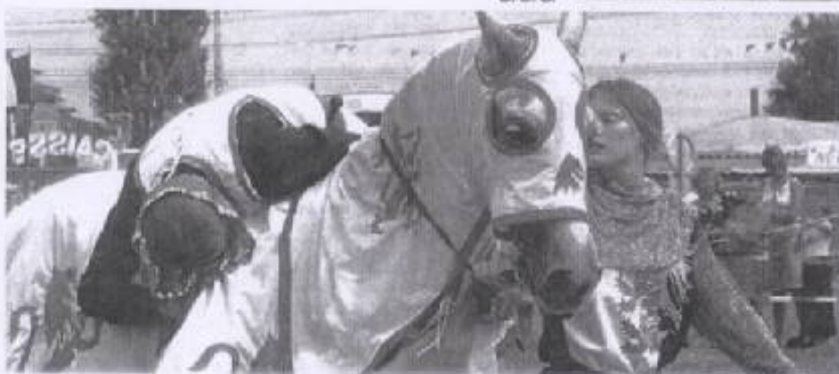
Adresse et passion du cheval sont autant d'atouts de la jeune compagnie.