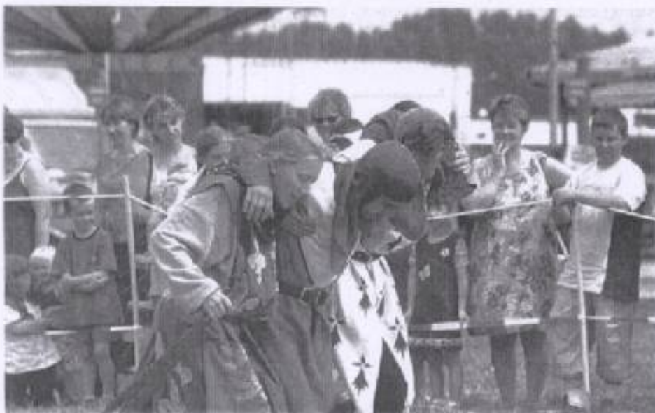
L'esprit d'équipe est de rigueur au sein de la compagnie. Ils sont une trentaine à s'entraîner régulièrement.