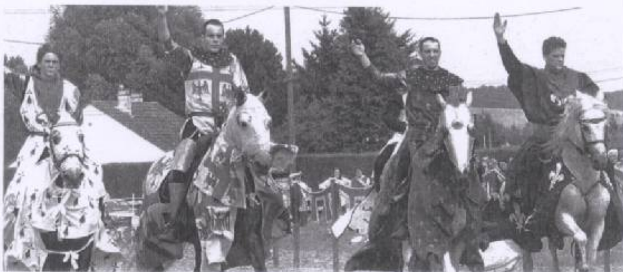
La compagnie Cheval spectacle aura créé l'événement au sein du petit village.

vait alors être particulièrement fier de la prestation de ses jeunes élèves. Conduite et combats à cheval, scène ouverte et jeux d'acteurs auront néanmoins subjugué les habitants de Berthecourt.