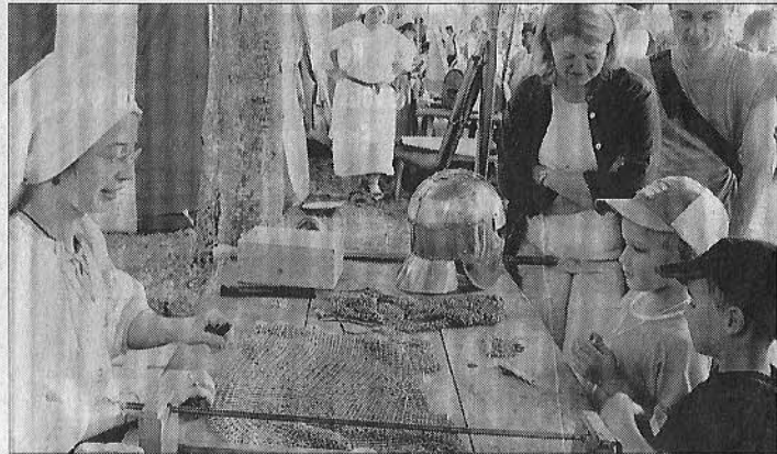
COUTURE. Les petits ont pu essayer les cottes de mailles.

■ Pratique. Visites tous les jours, de 10 heures à 12 heures et de 14 heures à 18 h 30. Prochain rendez-vous : le 28 juillet, avec une conférence sur les Templiers en Berry, par Pierre Durenton, historien.