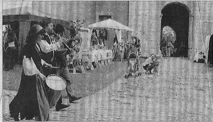
ACCUEIL. Les troubadours de l'ensemble Aymerillot ont reçu les invités du château, à la porte de l'impressionnant donjon.