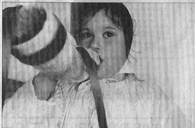
La passion n'attend pas le nombre des années. Surtout lorsqu'il s'agit de souffler de toutes ses forces dans une corne, pour annoncer l'heure du repas !