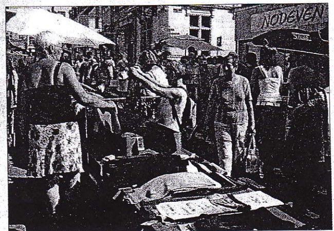
Le déballage se déroulera vendredi et samedi.