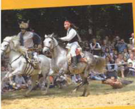
gentil cowboy, prises avec les méchants indiens...