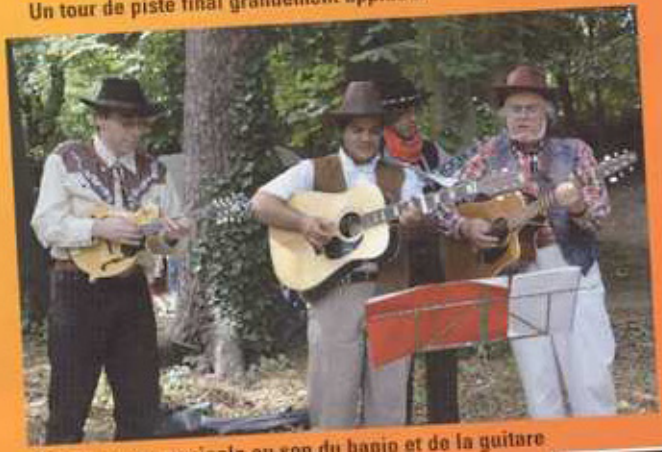
Petite pause musicale au son du banjo et de la guitare