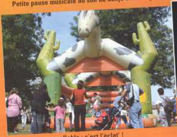
La structure gonflable : c'est l'éclat !