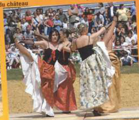
Un petit French Cancan en plein air...