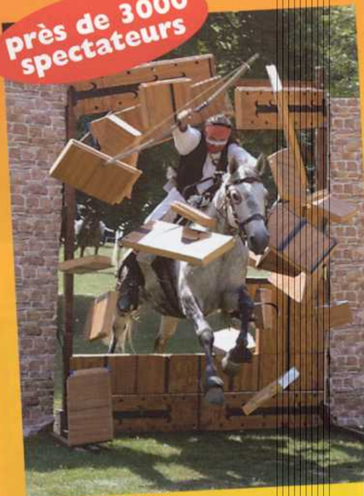
Unique : le numéro de la porte