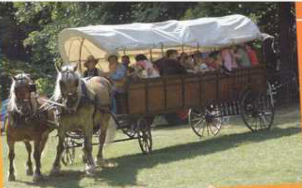
Sympathique balade en chariot dans le parc du château