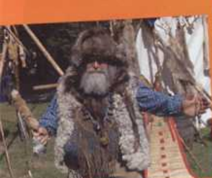
Le farwest : un monde impitoyable...