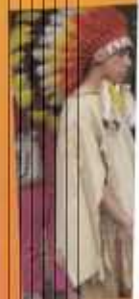
Tir à l'arc et