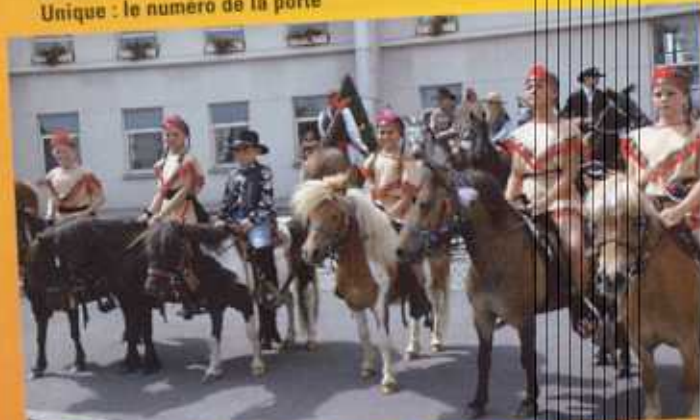
Gentilles squaws à poney sur le parvis de l'hôtel de ville