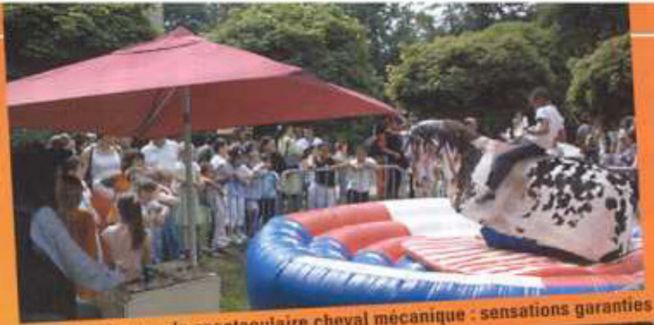
Gros succès pour le spectaculaire cheval mécanique : sensations garanties