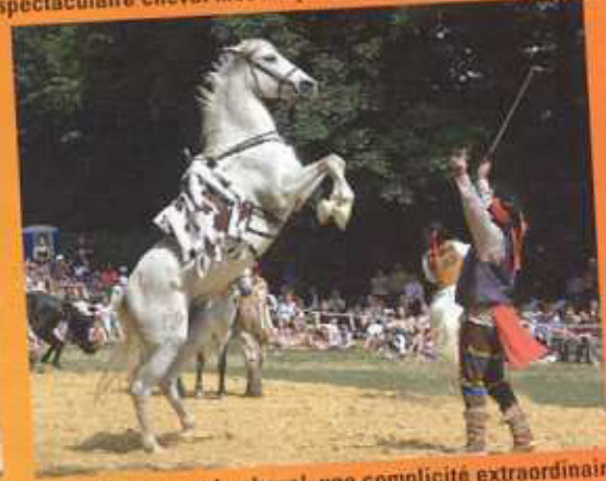
Entre l'homme et le cheval, une complicité extraordinaire