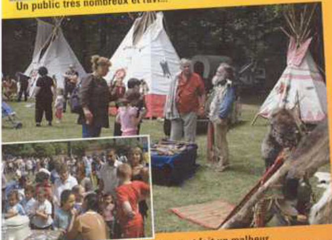
Le camp trappeur et le stand maquillage ont fait un malheur