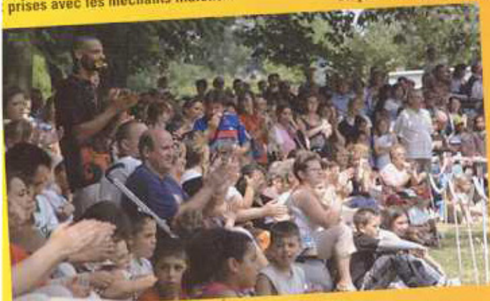
Un public très nombreux et ravi...