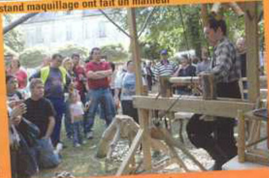
Au temps où l'électricité n'existait pas, l'ébéniste avait bien du mérite