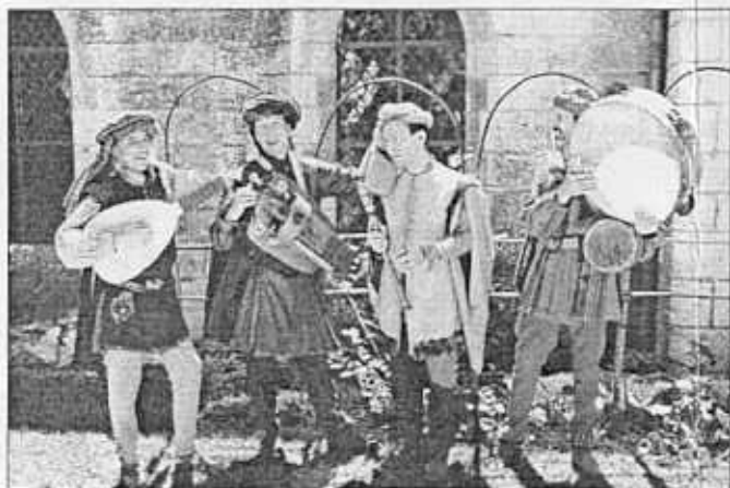
Musiques, chants, danses et fabliaux, le programme au logis royal était plus « feutré » mais pas moins apprécié, avec notamment le bal médiéval organisé en fin d'après-midi.