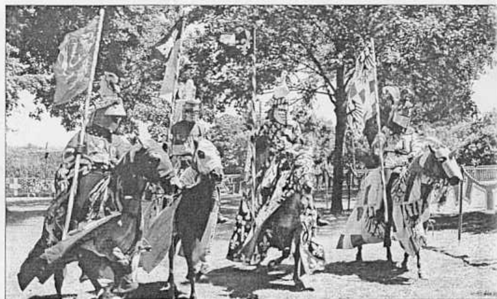
Du défilé dans les rues de la ville en passant par les joutes, le dressage, la voltige et les cascades, les cavaliers et leurs montures ont été omniprésents lors de cette fête des fous.

Et si, en ce dimanche ensoleillé, le tavernier a été beaucoup sollicité, c'est bien le défilé des fous costumés à travers la ville qui a ouvert la voie à une journée où tout est permis. Permis surtout de